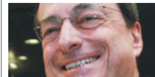
Mario Dragui.

El presidente del BCE, Mario Draghi, ablandó ayer las condiciones de acceso a sus subastas de liquidez, mientras el Banco de Inglaterra volvió a la compra de activos. ■ P16